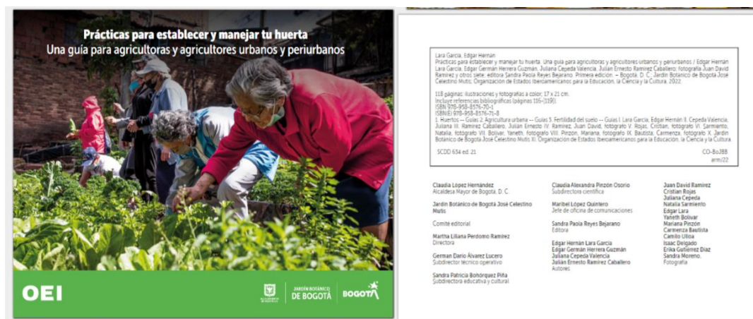
Ilustración 14. Portada cartilla “ Prácticas para establecer y manejar tu huerta, una guía para agricultoras y agricultores urbanos y periurbanos ” Además, se han publicado algunos datos resultados de las investigaciones del equipo. Datos publicados en el SIB Colombia, https://doi.org/10.15472/vmdv3m Resumen en Temas Agrarios Vol 6 suplemento 1 2021.