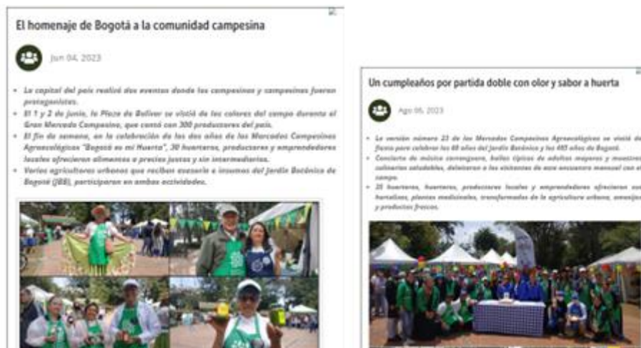
Ilustración 7. Publicaciones realizadas en la plataforma de Cocreación Bogotá es mi huerta: