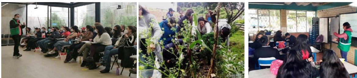
Ilustración 11. Capacitaciones: Grupo Uniandes Loc. La Candelaria, Grupo La Cecilia y Grupo Concientihuerta I.E.D. La Belleza, Loc. San Cristóbal. 2022.