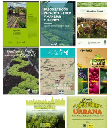
Ilustración 22. Promoción y divulgación.