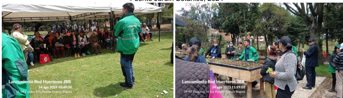
Ilustración 13. Correspondientes al lanzamiento de la red de agricultores Localidad de Puente Aranda.