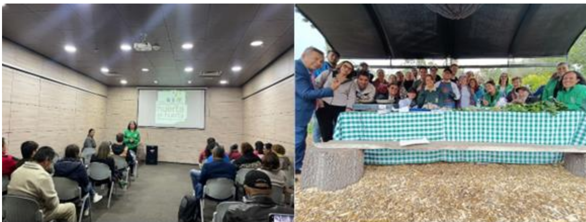
Ilustración 8. Presentación “De huerta en huerta” a Servidores turísticos, 3 de abril de 2024.