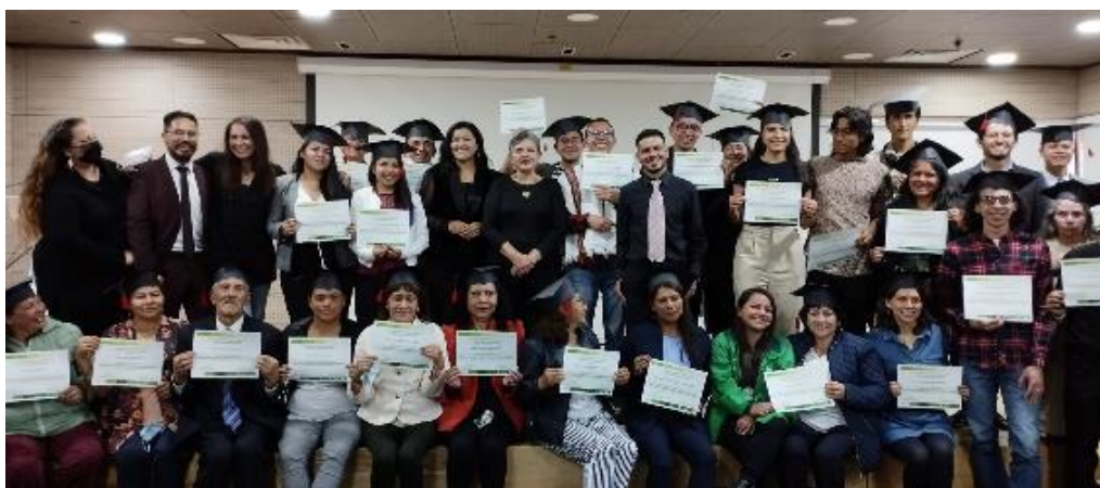
Ilustración 19. Diplomado de Agricultura Urbana.