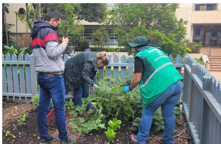
Ilustración 2. Asistencia Técnica a Huerta Institucional - Huerta de Palacio Liévano alcaldía Mayor de Bogotá- Localidad La Candelaria – marzo 2024.