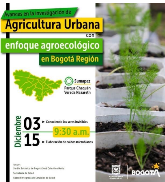
Ilustración 16. Transferencia de conocimiento, propagación de las especies trabajadas (3 y 15 de diciembre 2021).