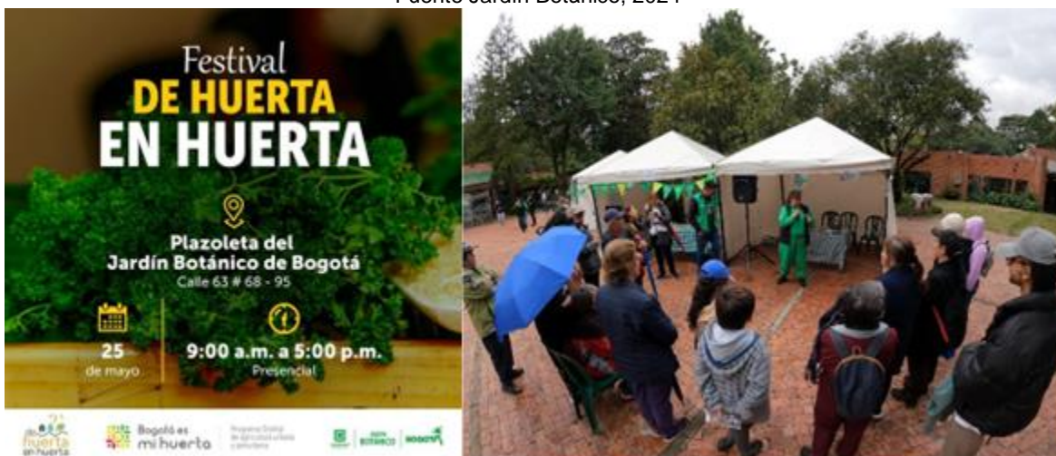
Ilustración 9. “De huerta en huerta”, 25 de mayo de 2024.