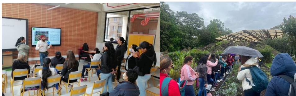
Ilustración 1. Curso básico de agricultura urbana, localidades de Bosa y Engativá.