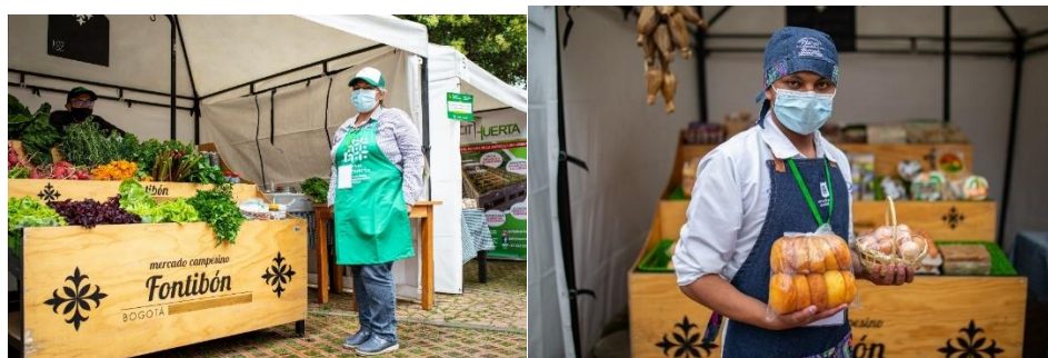
Ilustración 18. Agricultores urbanos y Comerciantes Plazas Distritales.