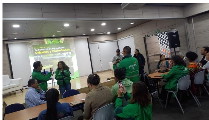
Ilustración 3. Encuentro voceros – Red Distrital de Agricultura Urbana y Periurbana Agroecológica.