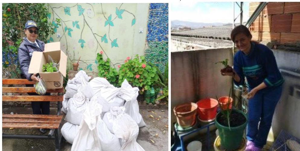
Ilustración 10 Fortalecimiento Huerta Escolar Colegio Estrella del Sur Sede B, Localidad de Ciudad Bolívar.