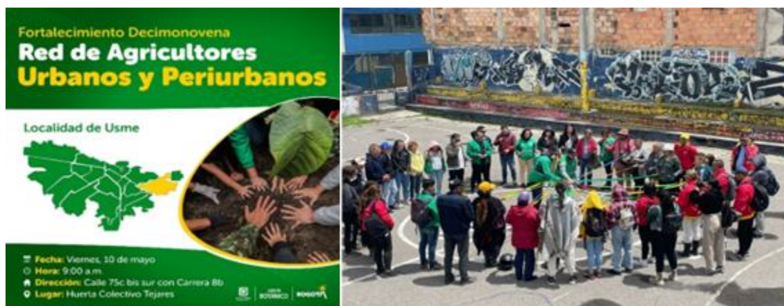
Ilustración 5. Lanzamiento Red de agricultura urbana de Usme