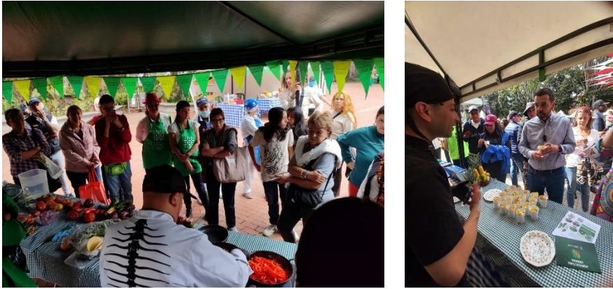
Ilustración 6. Participación ferias Gastrobotánicas.