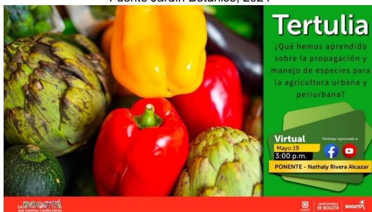
Ilustración 17. Imágenes de tertulias 2023