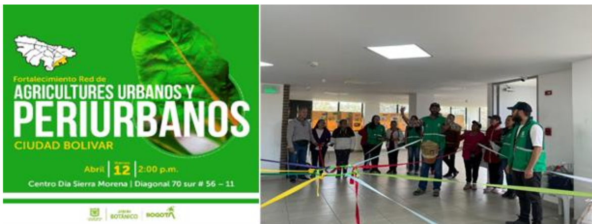
Ilustración 4. Encuentro voceros – Red Distrital de Agricultura Urbana y Periurbana Agroecológica.