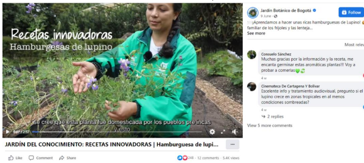
Ilustración 15. Capturas de pantalla de los videos de recetas innovadoras